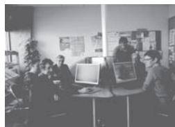
Atelier d'initiation et/ou de perfectionnement à l'usage d'un ordinateur.

Session le mardi à partir de novembre à la Pommeraye Session le vendredi à partir de janvier à St Florent.